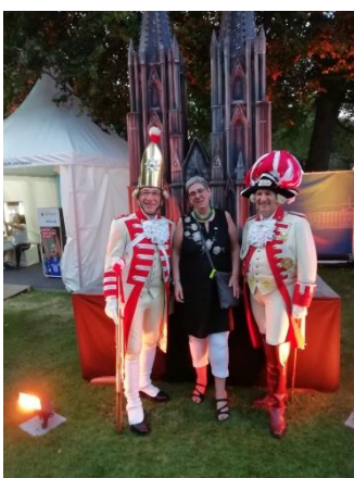
Der Gastgeber mit Partnerin Bundespräsident W. Steinmeier