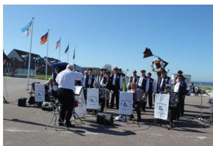
man beachte die „Weite“