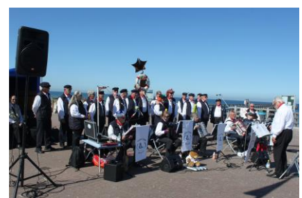
.....und nun Pause