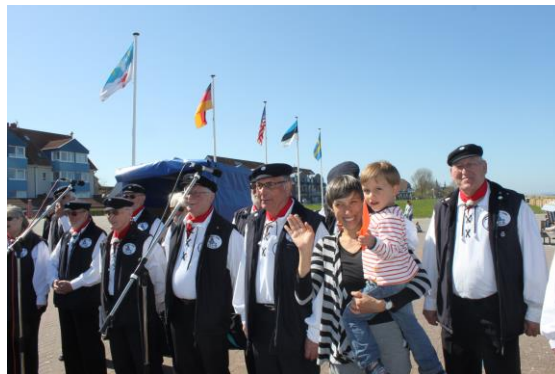
kleiner Mann, ganz groß